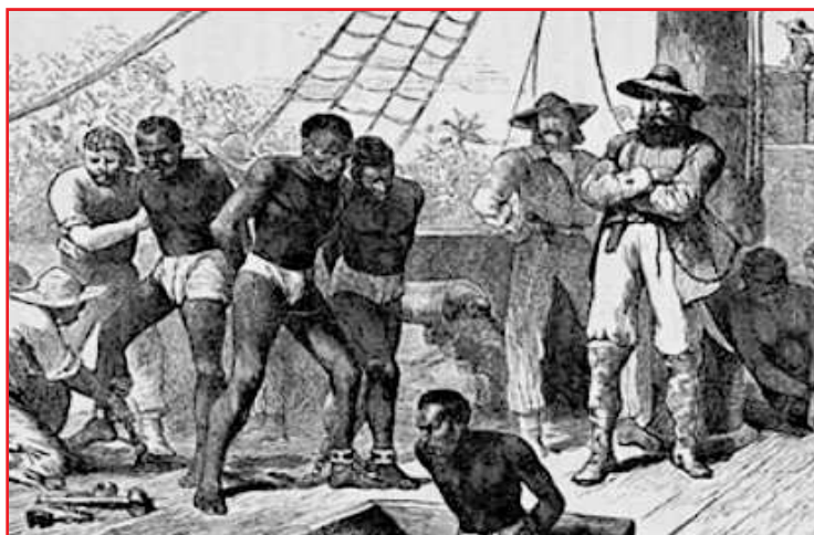
Traslado de esclavos hacia América

La esclavitud como institución ha tomado formas muy diversas a lo largo de la historia de la humanidad, y nuestra civilización, la del capitalismo en crisis; en el que una pequeñísima cúpula financiera domina los principales resortes del poder económico y político, conoce, en pleno siglo XXI la multiplicación de nuevas formas de esclavitud; y ello